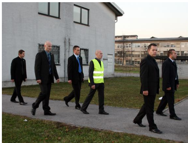
CP Team ob spremstvu - Teksaška zvezda