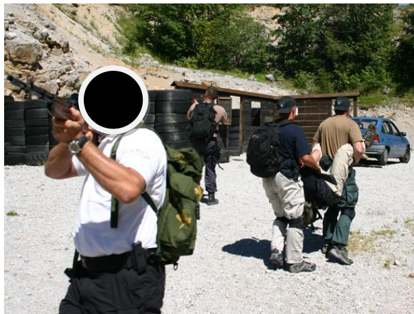
CP Team ob zaščitnem spremstvu HIGH RISK - varovana oseba je ranjena