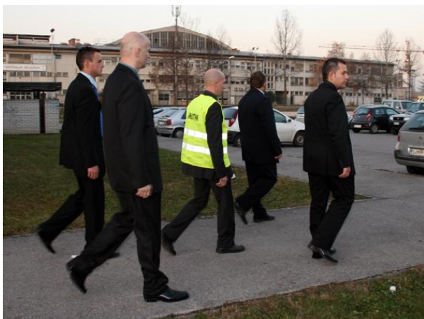
CP Team ob zaščitnem spremstvu