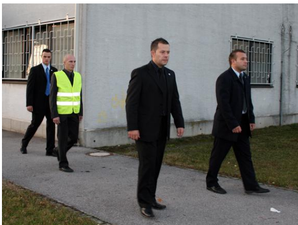
CP Team v gibanju - Triangle.