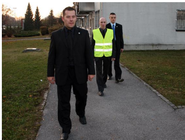
CP Team ob zaščitnem spremstvu

Za konec, prav vse naloge Close protection team-a oziroma skupine za varovanje oseb, ki so našteje kot naloge "varnostne skupine" so zelo pomembne. Nobena ni bolj pomembna od druge. Pri vseh nalogah moramo dati vse od sebe in jih opraviti maksimalno ter 110%.